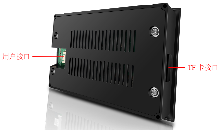
图 1 产品外观及硬件配置图